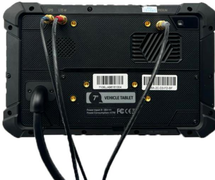
Figura 3 - Connettori antenne

Si chiede inoltre particolare attenzione alla gestione dei cavi, i quali non devono essere in alcun modo danneggiati: non tirare i cavi o effettuare giunte, se il cavo viene danneggiato è obbligatorio acquistare una nuova antenna. Dopo un incidente o cappottamento, è necessario verificare nuovamente tutti i cablaggi e i connettori delle antenne.