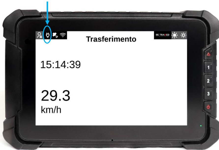
Figura 1 - Spia alimentazione di colore bianco: dispositivo alimentato correttamente